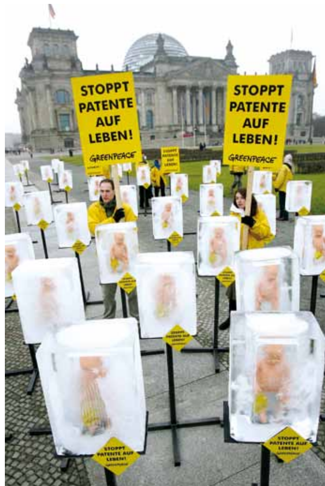
Des militants de Greenpeace manifestent devant le parlement allemand contre la brevetabilité de la vie humaine.

Ne nous y trompons pas, cette décision ne concerne que la brevetabilité des