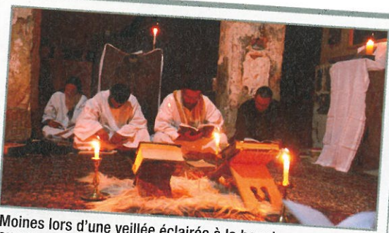
Moines lors d'une veillée éclairée à la bougie au monastère de Mar Moussa (Syrie).