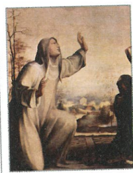
Catherine de Sienne.

Journée de la femme Catherine de Sienne a fait la Une de la page d'accueil de Wikipédia à l'occasion de la Journée de la femme, rapporte La Vie . « Chaque jour, en effet, les contributeurs de l'encyclopédie participative sont invités à voter pour choisir quel article, parmi les nouvelles entrées proposées, sera mis en exergue sur la page d'accueil », explique l'hebdomadaire.